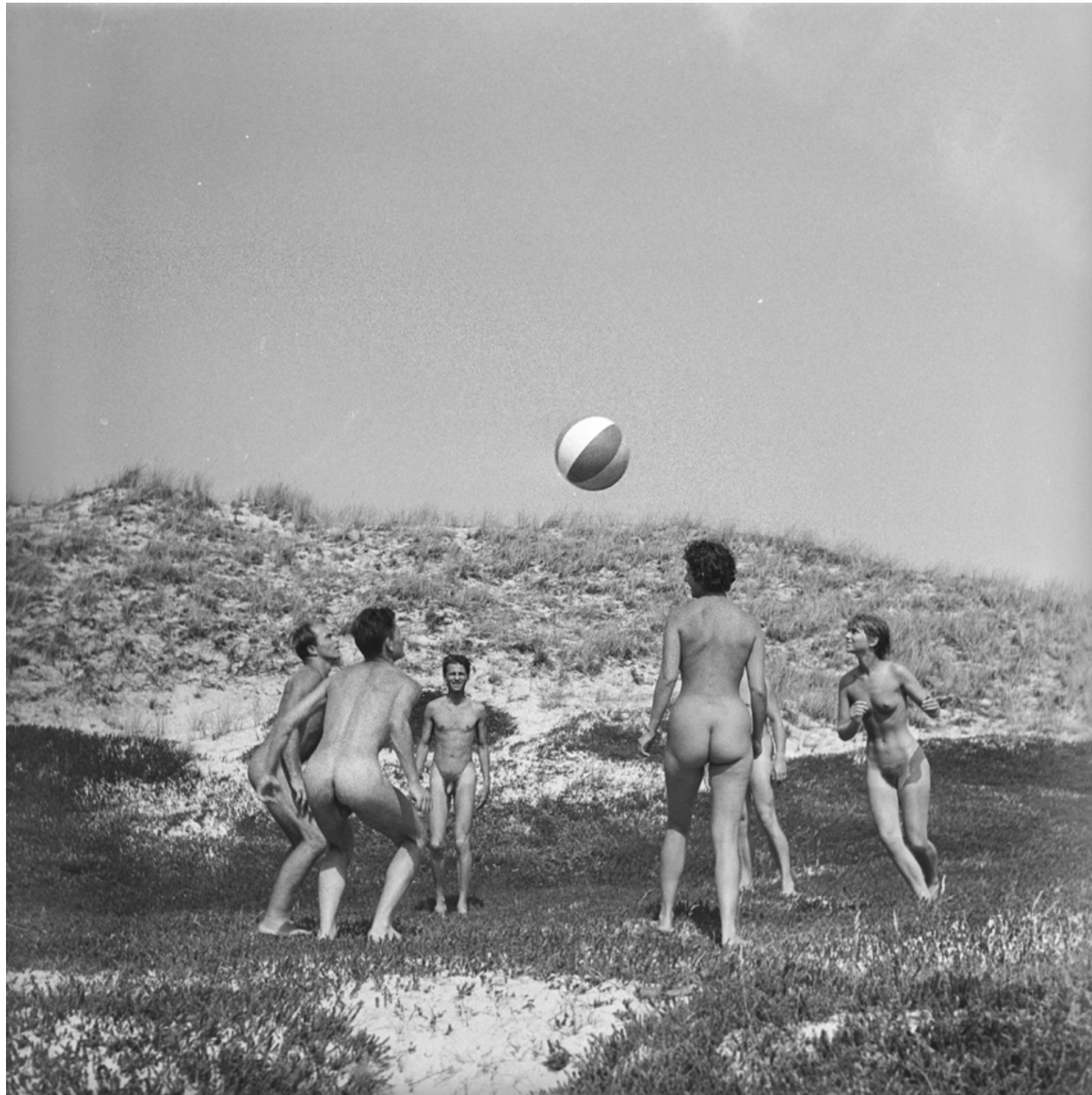
Extrait n°45 du film NATURISTEN-FERIEN (1958), tirage d'après la pellicule, extrait d'Archiv Imperial Film. © Werner Kunz Avec l'aimable autorisation d'Édition Patrick Frey, Zürich.