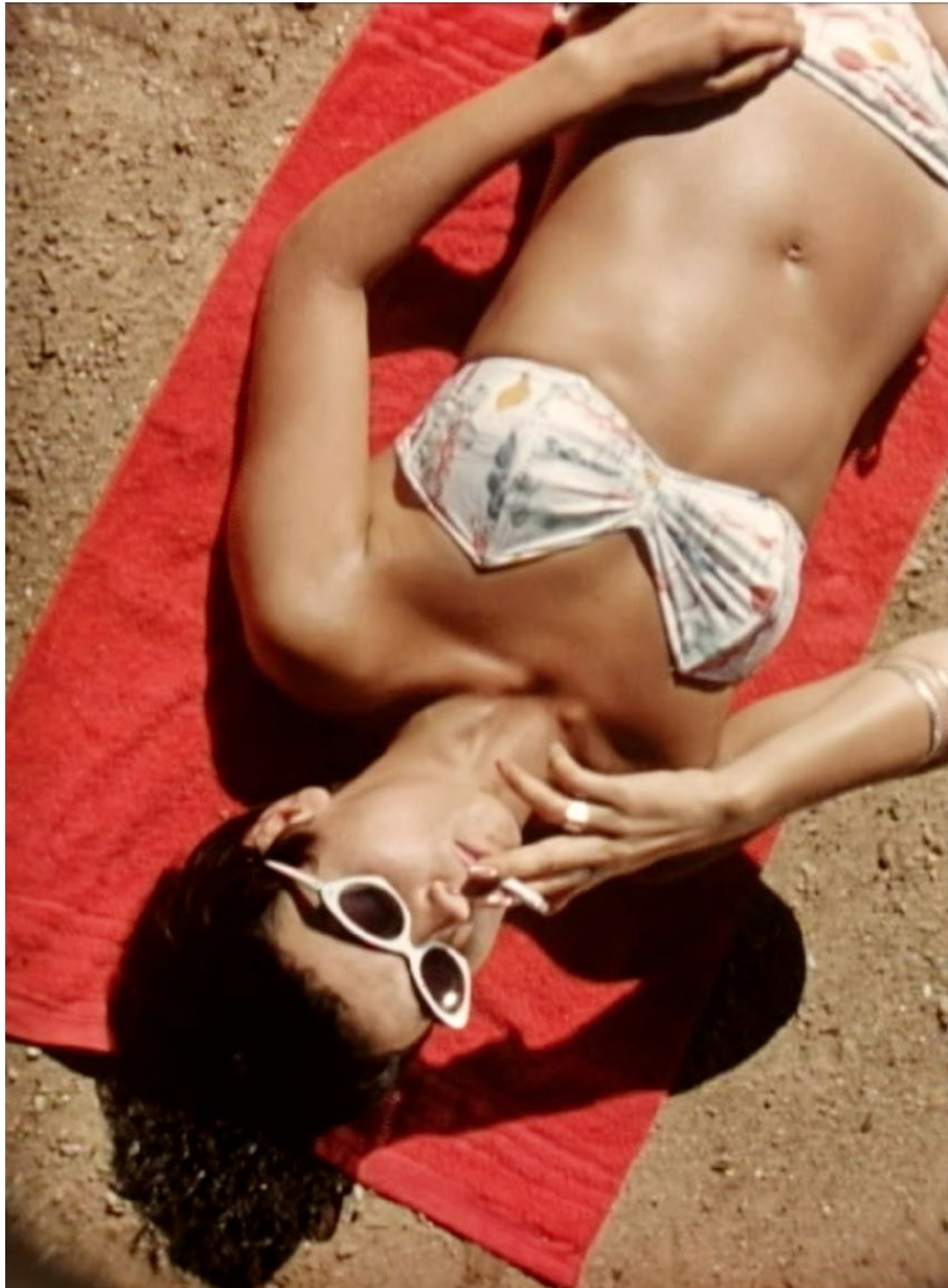
Photogramme extrait du film WIR FAHREN ZUM NATURSTEN-PARADIES 1957.