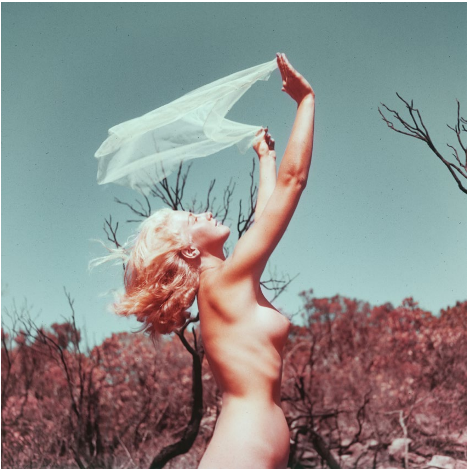
Extrait n°75 du film WIR FAHREN ZUM NATURISTEN-PARADIES (1957), tirage d'après la pellicule, extrait d'Archiv Imperial Film. © Werner Kunz. Avec l'aimable autorisation d'Édition Patrick Frey, Zürich.