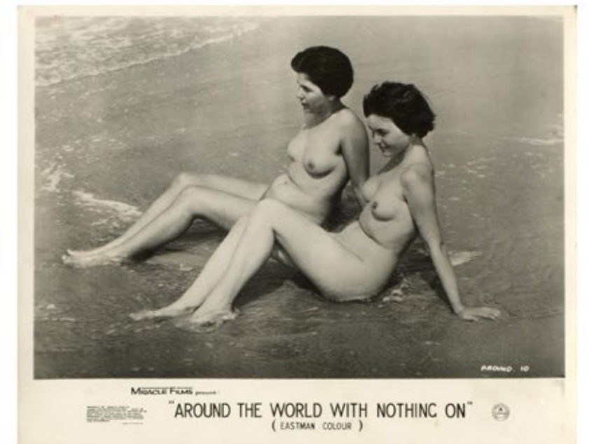
Série d'affiches pour le film AROUND THE WORLD WITH NOTHING ON , publiées à Londres. Extraites des archives personnelles de Matthias Uhlmann. © Werner Kunz Avec l'aimable autorisation d'Édition Patrick Frey, Zürich.