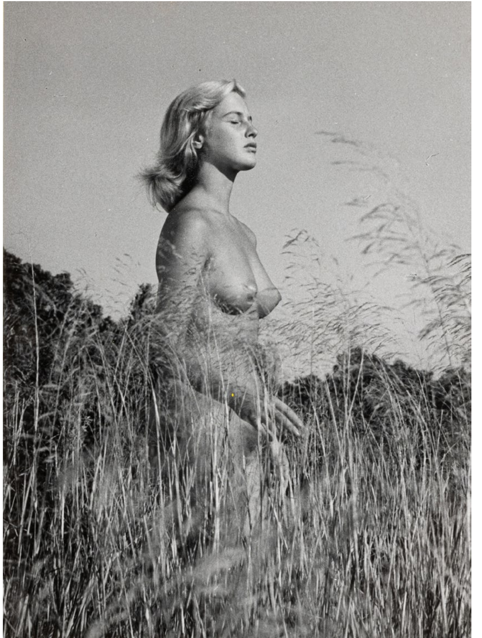
Photographie de plateau du film WIR FAHREN ZUM NATURSTEN-PARADIES (1957)