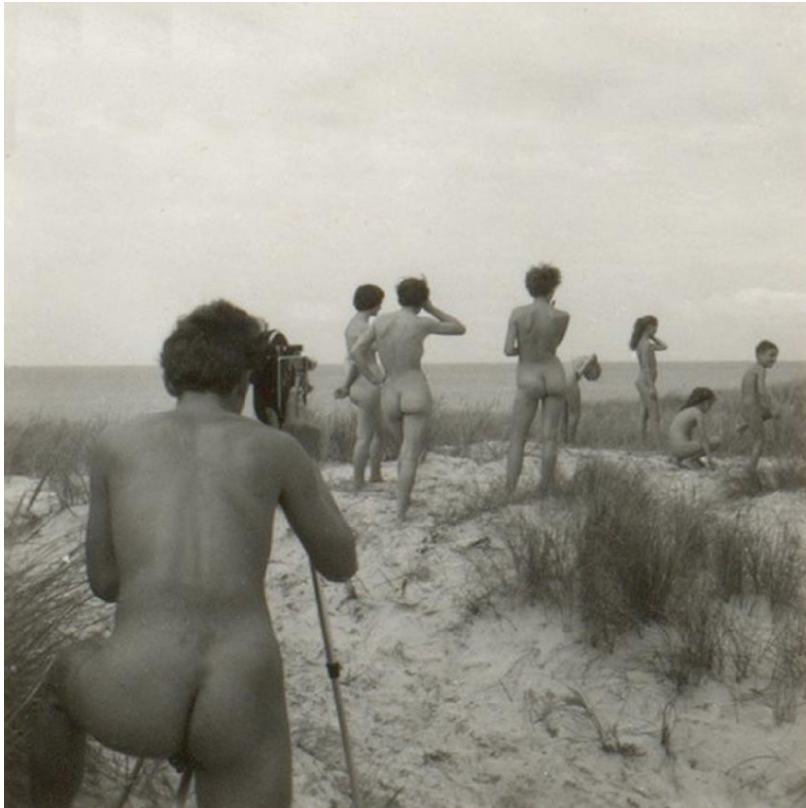
Photographie du tournage fictif (à des fins promotionnelles) de SYLT, PERLE DER NORDSEE (1955).

Esprit sain – Corps sain, Nus dans la neige, Nous irons à l'île du Levant, ou encore Le soleil sur la peau , les titres des films de Werner Kunz ne trouvent peu ou pas d'écho dans la mémoire des cinéphiles les plus aguerris. Et pourtant : le réalisateur suisse a livré des dizaines de courts et longs-métrages entre les années 1950 et 1970, explorant le mode de vie naturiste.