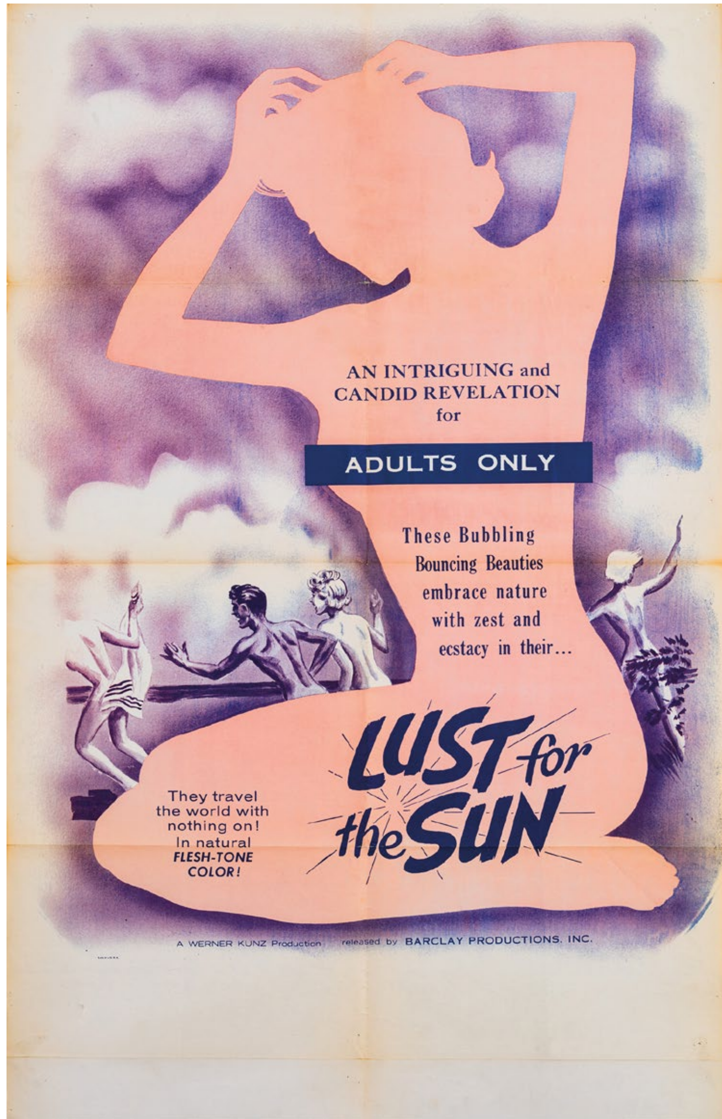
Affiche du film LUST FOR THE SUN , éditée par Barclay Productions (New York), extraite des archives personnelles de Matthias Uhlmann. Avec l'aimable autorisation d'Édition Patrick Frey, Zürich.