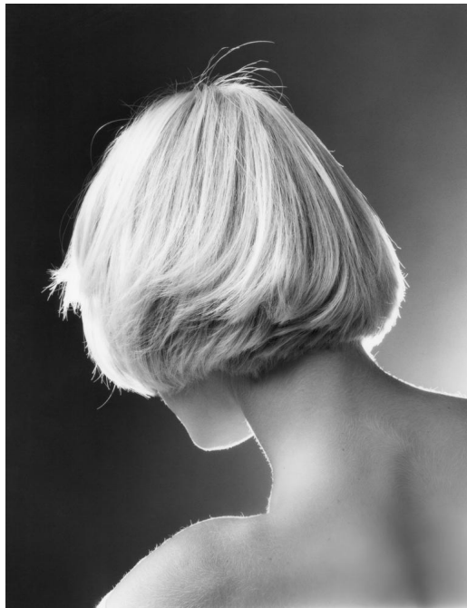
Bild aus dem Band "Fünf Finger Föhn Frisur"